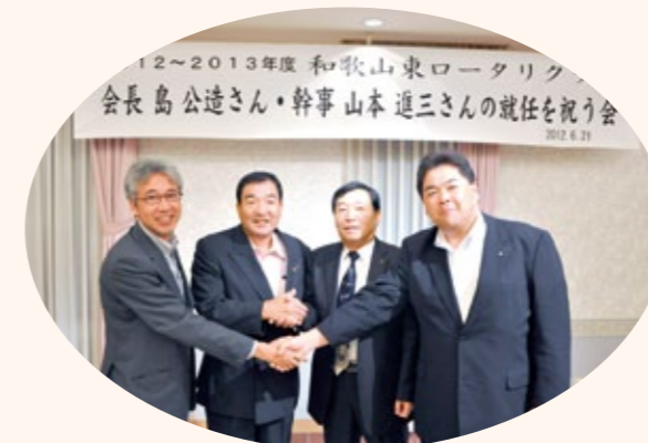
新旧会長・幹事のエール交換

予定より10年程早い就任です。力不足ですが是非御協力下さい。会員増強に注力して60名迄目標としています。