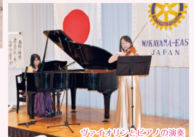
ヴァイオリンとピアノの演奏