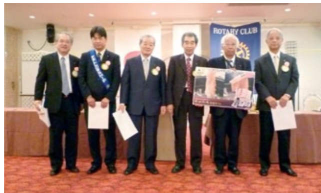
おめでとうございます!

【本日の累計 89,200円(計10名 14件)(お誕生日お祝い 610,000円 皆出席表彰 150,000円 その他 2,272,996円) 累計額 3,032,996円】