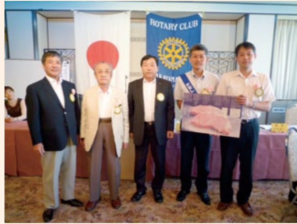
おめでとうございます!

明日24日で46歳になります。来年も祝ってもらえるように健康で居たいと思います。