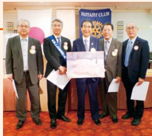
おめでとうございます!