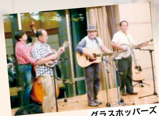
グラスホッパーズ