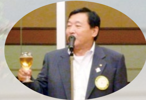
島直前会長乾杯あいさつ