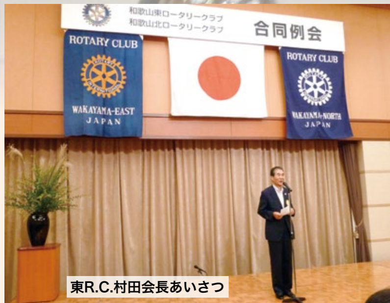
東R.C.村田会長あいさつ