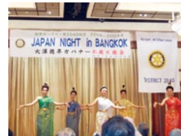
2640地区ジャパンナイト

最後に、スマートイト・ライシット黄金仏をご紹介します。世界最大の黄金仏像、高さ4m、重さ55トン16キロ、700年前に製造されたのですが、これが現代のスクラップ価格にして150億円以上の仏像です。現地ではこの黄金仏像は良い夢を叶えてくれるということで非常に御利益があるとのことでした。せめて写真だけでも、皆さんの幸福とご発展をこのスマートイトライシット黄金仏がかなえてくれますようお願いしてバンコクの旅の終わりとしてさせていただきます。ご清聴ありがとうございました。