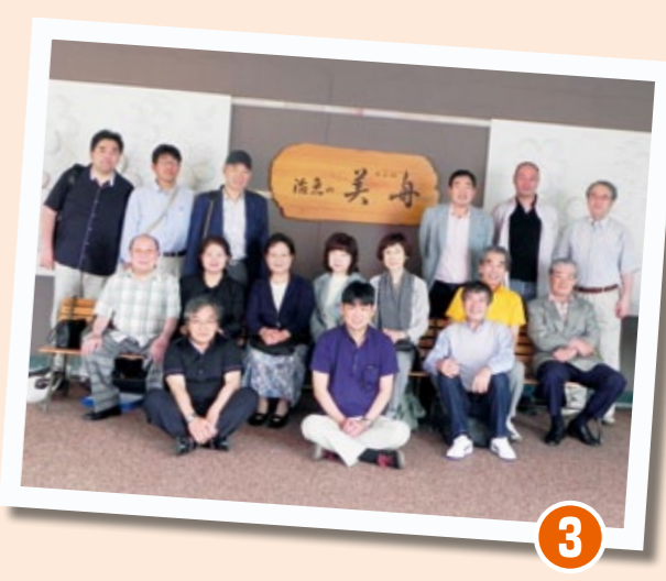
昼食は名物“ひつまぶし”(なごや花亭美よし) = トヨタテクノミュージアム産業技術記念館 = JR東海リニア・鉄道館 = 活魚の美舟(宿泊・新鮮な海の幸) = 豊浜魚ひろば = 野間大坊 = 昼食自然薯 茶々