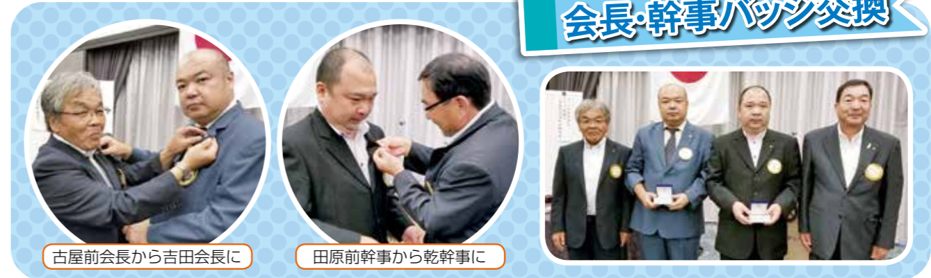
古屋前会長から吉田会長に