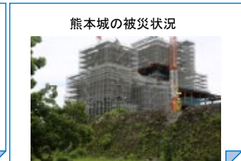
熊本城の被災状況