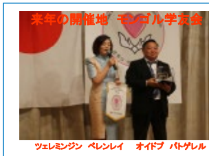
楽年の開催地 モロコシ学友会 ツェレミンジン ベレンレイ オイドフ ノトゲレル