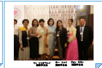
リン ジャオウェイ 謝中華会 郝一ユウ 謝中華会 ジェン キン 謝中華会