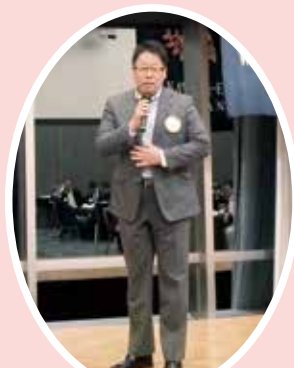
角谷副会長 終わりの挨拶