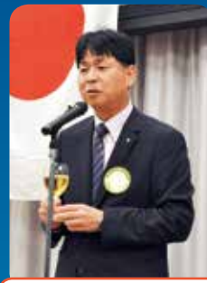
上中直前会長乾杯の挨拶