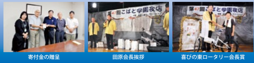
寄付金の贈呈 田原会長挨拶 喜びの東ロータリー会長賞 ユカタ姿の児童と東ロータリー役員